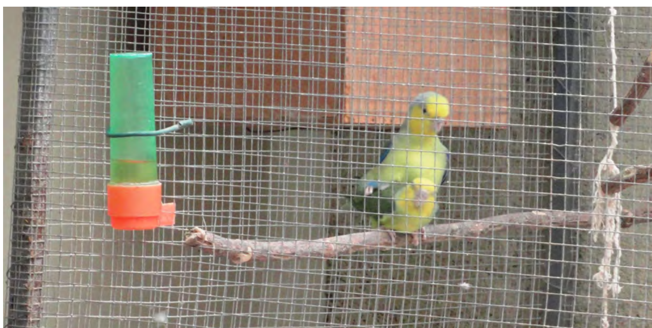
Figura 1. Pareja de Forpus xanthops copulando posados de una percha.

Las observaciones de comportamiento fueron realizadas diariamente de manera directa a través de una puerta de cristal oscurecido durante las mañanas entre las 06:00 y 08:00 horas. La medición de huevos fue realizada con un calibrador con aproximación a 0.05 mm. Se comparó las medidas obtenidas mediante la prueba de T-Student, utilizando el software EXCEL. Se llevó el registro semanal de los valores máximos y mínimos de Humedad relativa (%HR) al interior de las instalaciones.