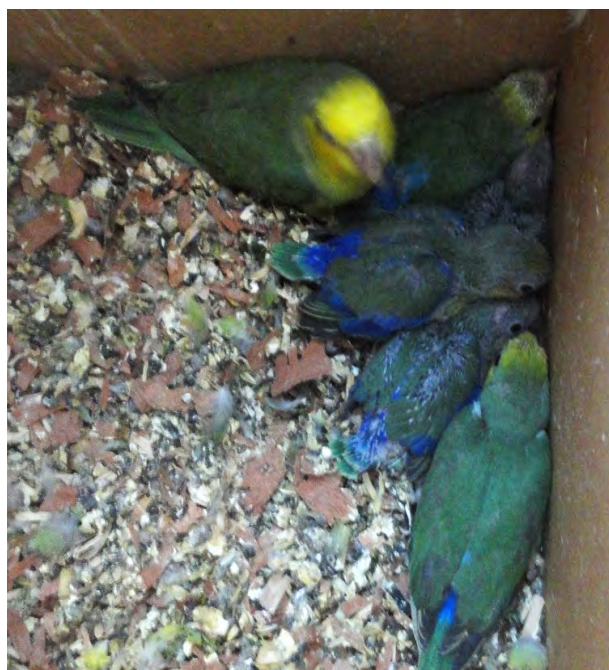
Figura 2. Diferencia de tamaño observado entre pichones de Forpus xanthops de una misma nidada.

Incubación: El tiempo exacto de duración se desconoce, sin embargo, se estima que dura entre 20 y 24 días. Esta es realizada exclusivamente por la hembra, en las cuales se observó el desarrollo de un parche incubatriz. El macho solo ingresa para alimentar a la hembra y en algunos casos ( n=3 ) para dormir por las noches. La incubación se inicia después de colocado el segundo huevo, lo cual ocurre a los dos días de la primera postura. A partir de este momento, la hembra sale rara vez del nido. El nacimiento de las crías se produce en diferentes días (Figura 2). En caso de que existiesen huevos infértiles, la hembra permanece incubando los huevos hasta los 30 días ( n= 2 ) momento en el cual abandona el nido sin destruir los huevos.